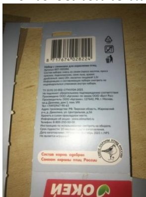
Фото выполнения работ